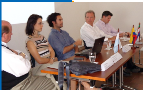
Directivos de Vectrix e Invest Pacific durante la rueda de prensa

Vectrix traerá dos de las marcas más importantes que tiene en el mundo en cuanto a movilidad eléctrica, las motos Vectrix y la línea de buses y camiones Smith. La primera prueba real de este tipo de motocicletas se hará a través de un convenio con la Policía Nacional, con un tipo de motos dotadas especialmente para el trabajo policial.