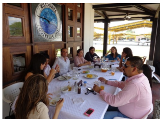
Instantes del almuerzo en la Zona Franca Palmaseca