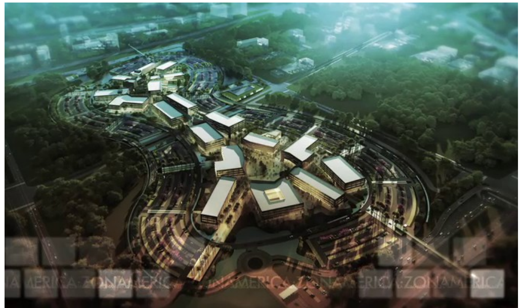
Maqueta de diseño del complejo Zonamérica