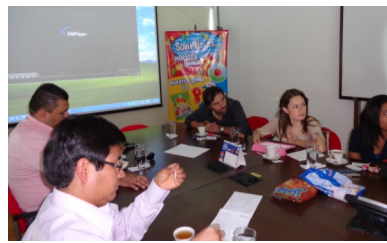
En Aldor, durante la presentación de la Agencia