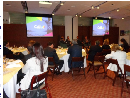
Dentro de los asistentes se encontraban diplomáticos, directores de cámaras binacionales y empresarios

La Alianza por el Pacífico es un bloque co-