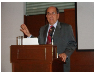
Alcalde de Cali, doctor Rodrigo Guerrero Velasco, haciendo la apertura del evento.

Con el objetivo de presentar lo que está pasando en nuestra ciudad y nuestra región, embajadores de diversos países, directores de cámaras binacionales, empresarios y líderes de opinión nacional, se dieron cita en la ciudad de Bogotá durante el foro “En Cali están pasando grandes cosas” evento convocado por la Alcaldía de Cali, la Cámara de Comercio de Cali e Invest Pacific con el apoyo de la Unidad de Acción Vallecaucana.