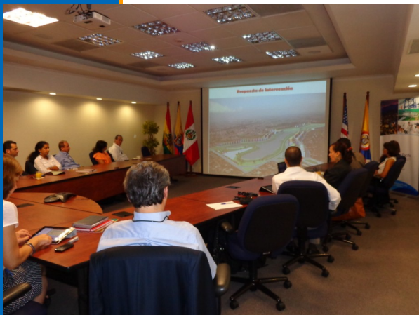
Miembros del Comité de Inversión Extranjera en reunión con los directivos de EMRU

encuentra trabajando de manera activa con los inversionistas instalados en pro del mejoramiento del clima de inversión. Para ello, junto con la Amcham constituyó el Comité de Inversión Extranjera conformado por 18 empresas con IED en el Valle del Cauca con el cual se reúne mensualmente para discutir temas de interés público-privado.