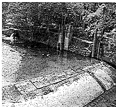
Fotografía 2 Río Cali en la captación de la bocatoma