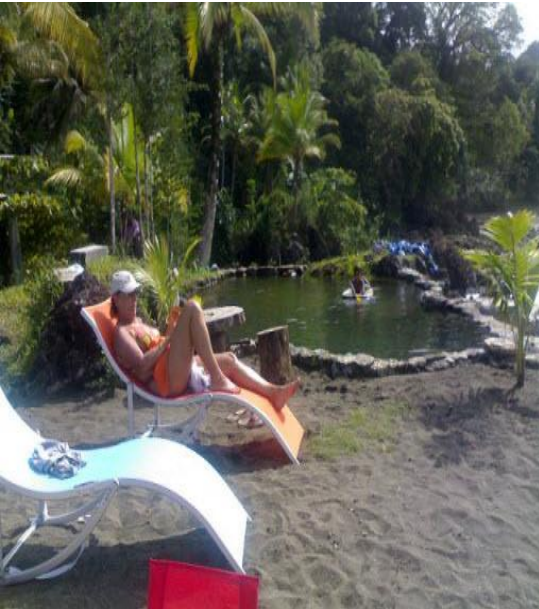
Nuquí - Choco

Convenio: No. 019 entre Organizaciones Solidarias y la Fundación Preservar Colombia.