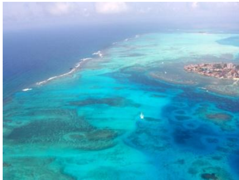
San Andrés Islas

Objeto: Fortalecimiento asociativo y empresarial solidario dirigido a 20 personas en calidad de población afrocolombiana.