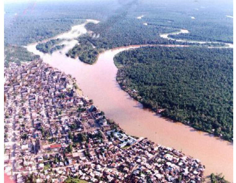
Quibdó - Chocó

Objeto: Promoción, fomento, fortalecimiento y desarrollo de procesos de integración en organizaciones del sector solidario del departamento del Choco con el fin de consolidar y desarrollar planes, proyectos e instrumentos que apoyen y faciliten la activa participación de las organizaciones solidarias del Departamento en la política pública del Estado hacia el sector solidario”.