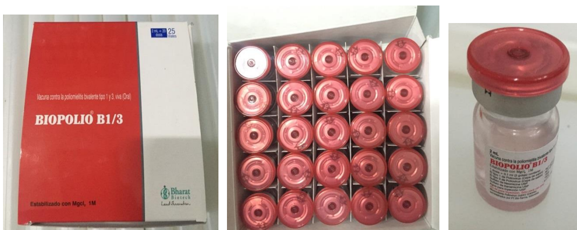
Gráfico 2. Presentación de la vacuna del laboratorio Bharat Biotech

Si consideramos que los termos utilizados en Colombia son los listados en la siguiente tabla, se debe considerar el número de dosis que es posible almacenar en un termo dejando como mínimo, el 50% del termo para los demás biológicos del esquema permanente, sin deterioro de la caja y con los paquetes refrigerantes respectivos.