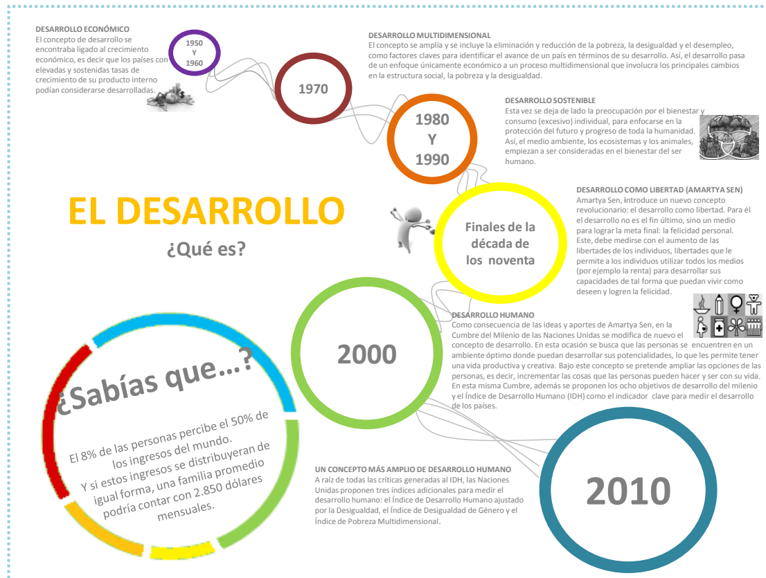
Figura 1. Resumen: Evolución del concepto desarrollo.