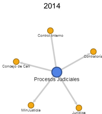
Figura 1: Grafo de Usuarios del PPI de la Dirección Jurídica