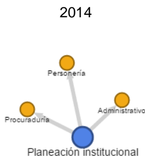
Figura 1: Grafo de Usuarios del PPI de la Dirección de Control Disciplinario