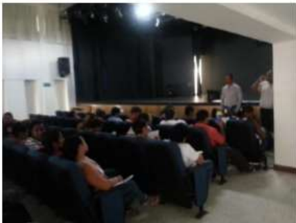
Taller 8 de noviembre

La Secretaría de Vivienda Social informa que: 38 personas asistieron al taller realizado el 8 de noviembre de 2013, en el Teatro la Unión (frente al CALI 16) para socializar: