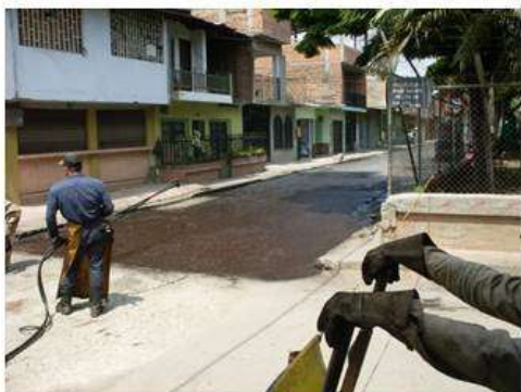
Foto: Obra de Bacheo Grupo Operativo Comuna 14