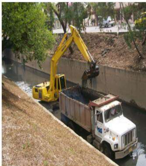
Obras de control de vertimientos en el canal cauquita