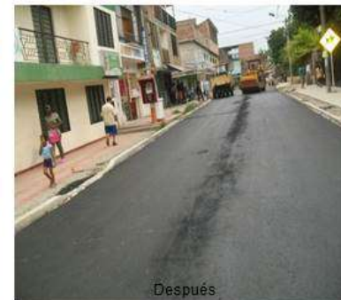
Foto: Transversal 80A entre Cras 26I2 y 26K