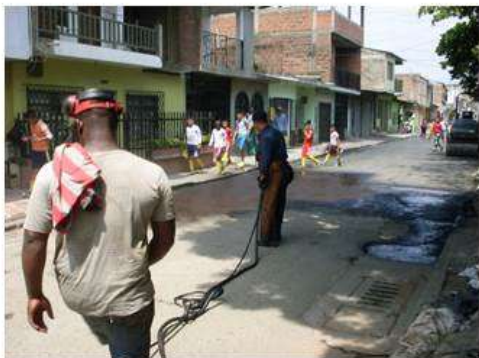
Foto: Obra de Bacheo Grupo Operativo Comuna 14

La Secretaría de Infraestructura y Valorización, realizó en Septiembre del 2013 el Bacheo de la Diagonal 26K entre Calles 73 y Transversal 101 , con el grupo operativo .