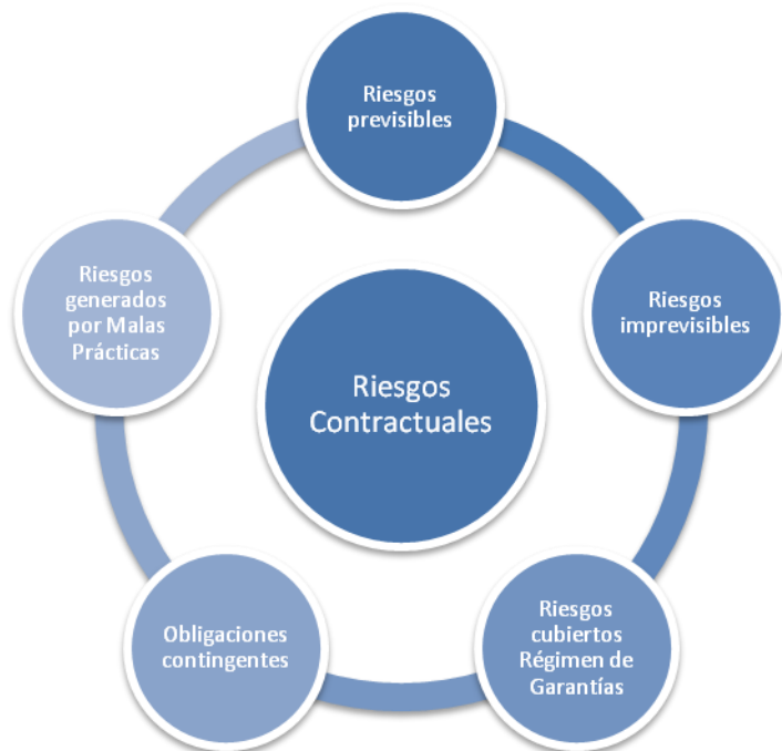
FIGURA 1 Riesgos Contractuales

Así, los “ riesgos previsibles ”, son todas aquellas circunstancias que de presentarse durante el desarrollo y ejecución del contrato, tienen la potencialidad de alterar el equilibrio financiero del mismo, siempre que sean identificables y cuantificables en condiciones normales.