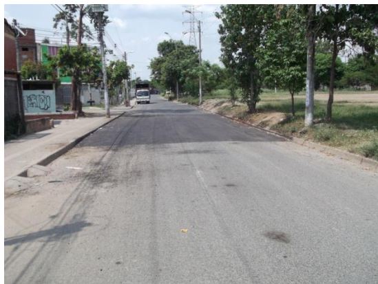
Foto: Calle 94 entre Carreras 23 y 25