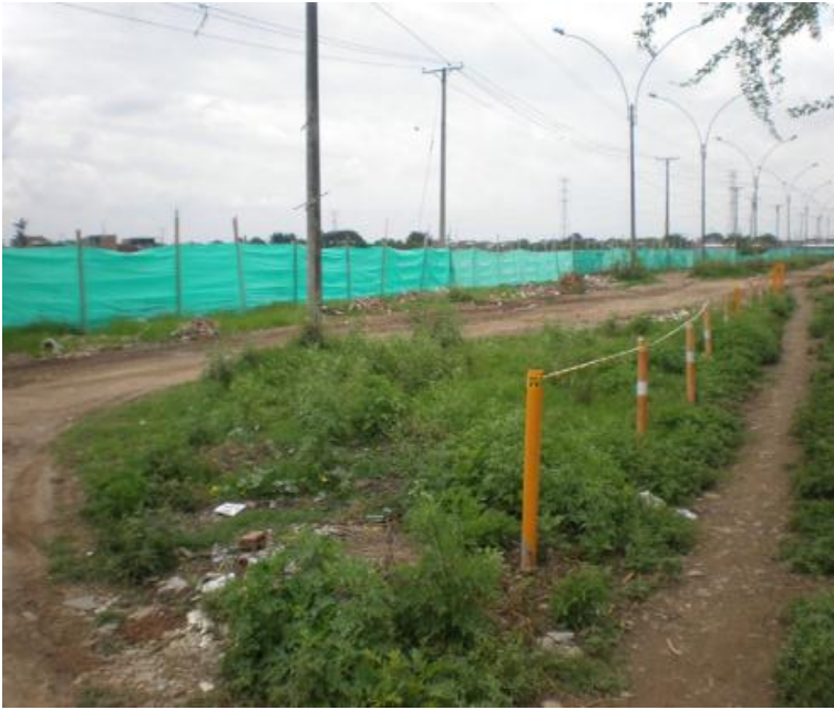
Foto: Predio en donde se realizaría el Patio Taller

La Secretaría de Infraestructura y Valorización informan que: