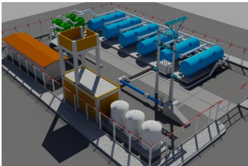
Las Orquídeas: Calle 116 Carrera 27DF