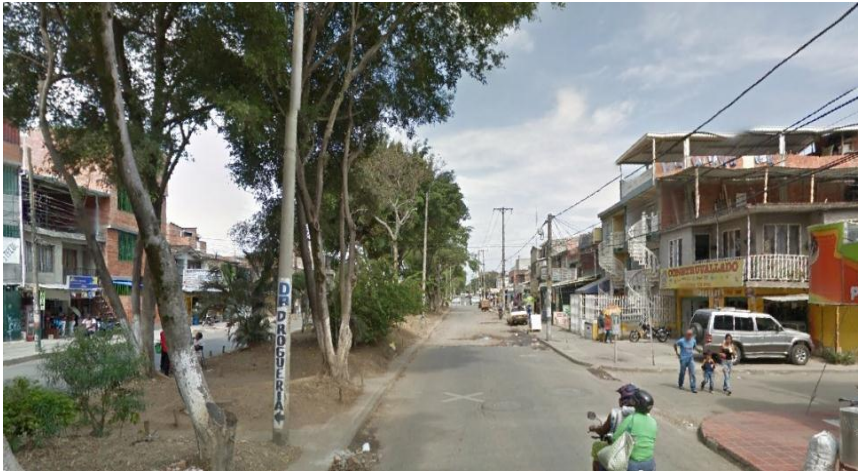
Ciudad Córdoba – El Vallado Carrera 41B con Calles 49

Metrocali adelantará la segunda fase de Pre troncales e intervendrá en la comuna dos (2) corredores viales: