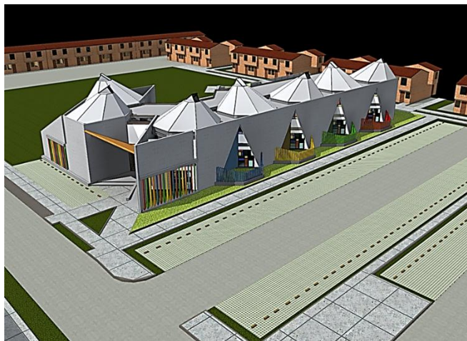
Diseños C.D.I Llano Verde