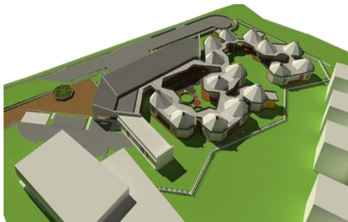
Diseños C.D.I CalIDA