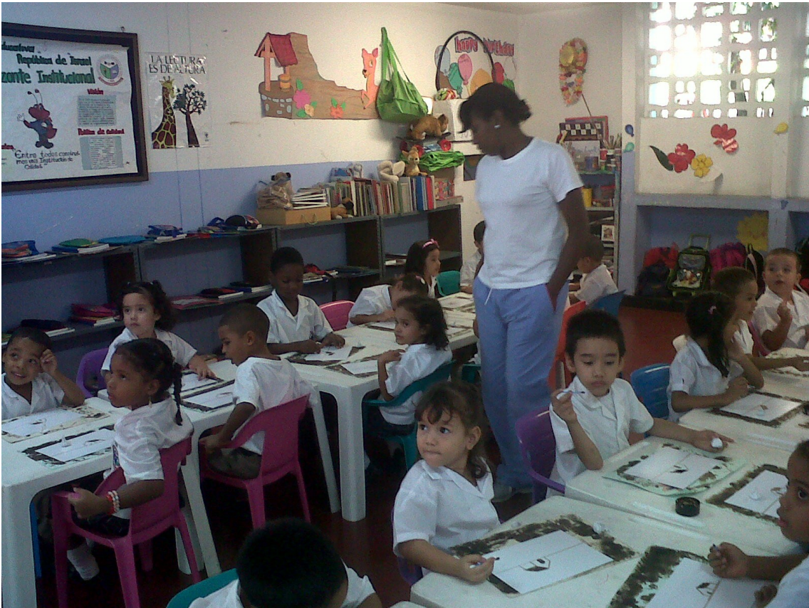
DIA DE LA FAMILIA IERI