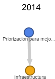
Figura 2: Grafo de usuarios de los PPI de la Secretaría de Infraestructura y Valorización