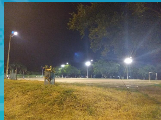
1015: (En Ejecución)