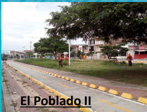
El Poblado II