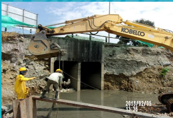
Construcción de estructura para compuerta radial