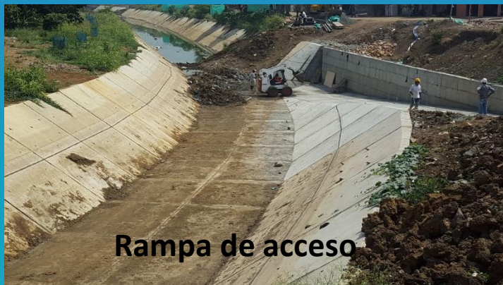
Rampa de acceso