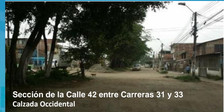
Sección de la Calle 42 entre Carreras 31 y 33 Calzada Occidental

Objeto del contrato: Construcción y Reconstrucción de: Dos calzadas de la calle 42 entre carreras 31 y 50 en las comunas 13 y 16 y Puente vehicular en la calle 42 con carrera 39E en la comuna 16.