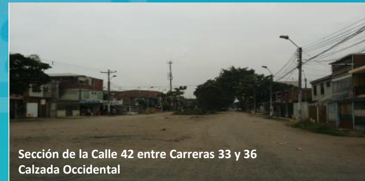
Sección de la Calle 42 entre Carreras 33 y 36 Calzada Occidental