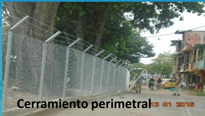
Cerramiento perimetral 13 01 2016