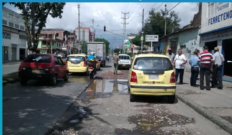
Recorrido Mayo 03