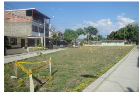
Parque B/San Marino, carrera 7j entre calles 68 y 67ª. Antes (izq) y Después (der)