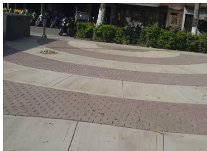
Parque B/Alfonso López I, carrera 7c bis entre calles 82 y 83. Antes (izq) y Después (der)