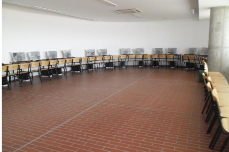
Instalación de piso y guarda escoba en tableta gress sala de sistemas – I.E.O Isaías Duarte Cancino