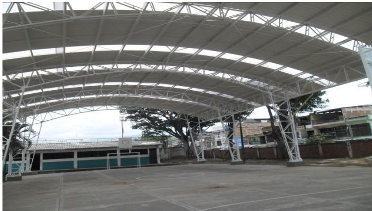
Cubierta en estructura metálica – I.E.O Ciudad Córdoba sede Enrique Olaya Herrera