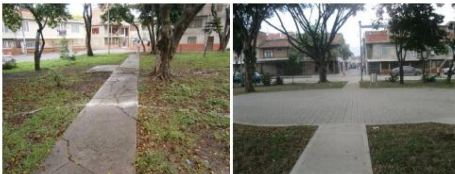
Parque San José Calles 52 y 52ª con carreras 39G y 40. Antes(izq) y después (der).