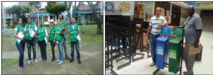
Dinamizadores comuna 15. Entrega de dotación I.E.

El DAGMA informa que con recursos de situado fiscal por $ 69.436.000 durante el 2014 realizó las siguientes actividades en el tema de residuos sólidos en la comuna 15: