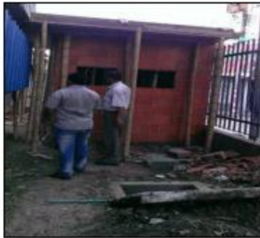
Construcción U.A.R. en I.E CARLOS HOLGUIN MALLARINO