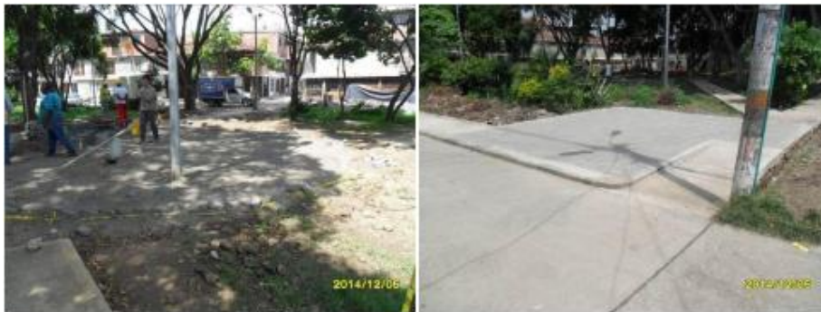
Parque El Vallado II los bomberos ks 39g y 39h con calles 56 y 57. Durante (izq) y después (der).