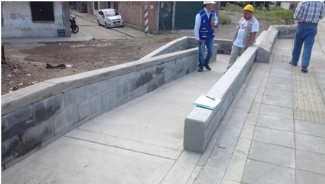
Marzo de 2015.

Metro Cali informa que en agosto de 2014 ejecutaron las obras para la adecuación del paso peatonal del puente.