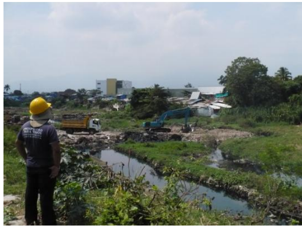
Durante la intervención