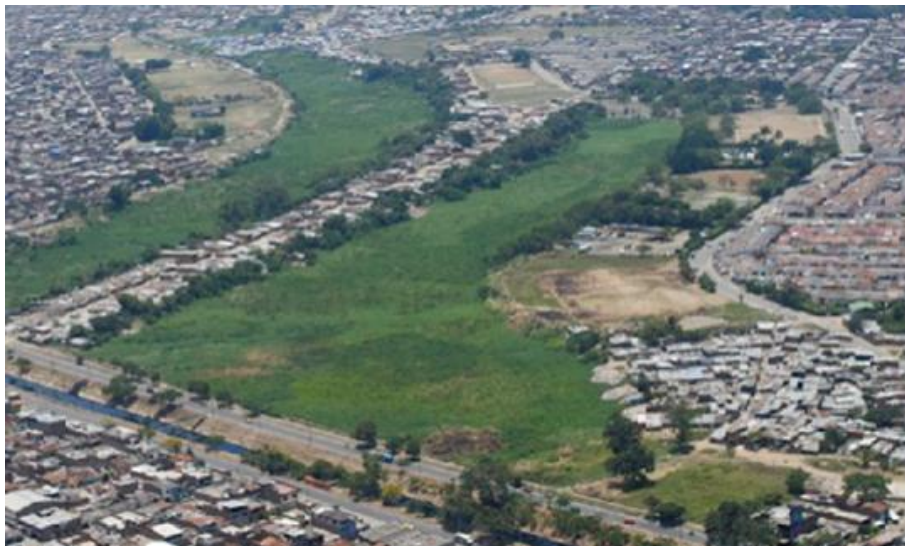
FASE I - ANTES DE LA INTERVENCIÓN