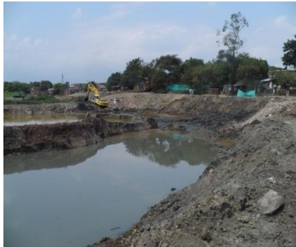
Estado de la Laguna Pondaje Fase II a Enero 30 de 2015

A Febrero/2015 la obra presenta un avance del 10%. A la fecha se está realizando: