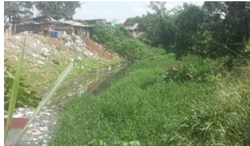
Antes de la intervención. Estado inicial de la Laguna Pondaje Sur

EMCALI con una inversión de $22.162'482.771,00 contratados en Agosto de 2014 con recursos del Fondo Adaptación (FA) y a través del Proyecto Plan Jarillón de Cali, adelanta la Fase II del proyecto “Mejoramiento Hidráulico de la laguna de regulación El Pondaje Sur”, la cual consiste en las siguientes actividades: