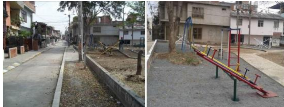
Parque B/villa blanca cra 26m con diagonal 72e. Antes (Izq) y Después (Der).