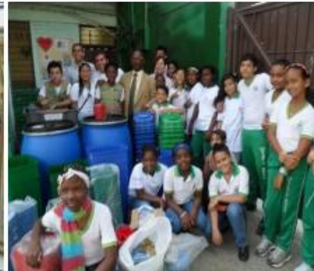
Visitas domiciliarias y entrega de dotación I.E.

El DAGMA informa que en el 2014 por valor de $72.6 Millones, realizó capacitación (B.P 43713) en manejo adecuado de residuos sólidos a 259 líderes de los siguientes barrios de la comuna 13: