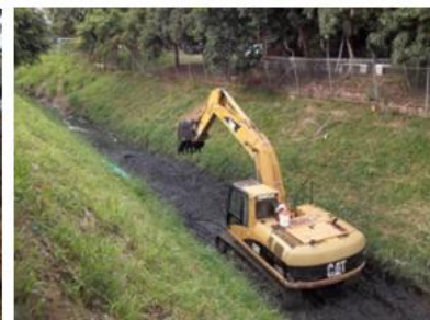
Control de vertimientos canal oriental - calle 73 transversal 73 a cauquita sur