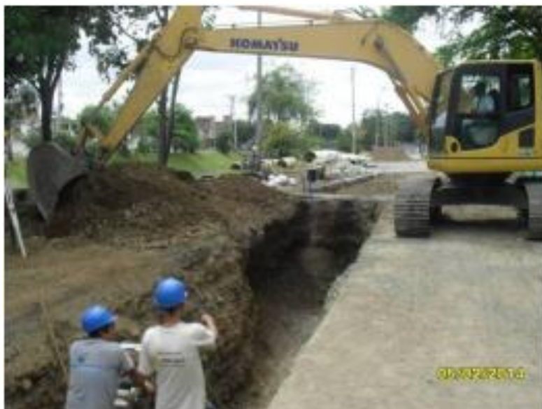
Colector en la Calle 73 (avenida ciudad de Cali) con Diagonal 26G5 a 26G7