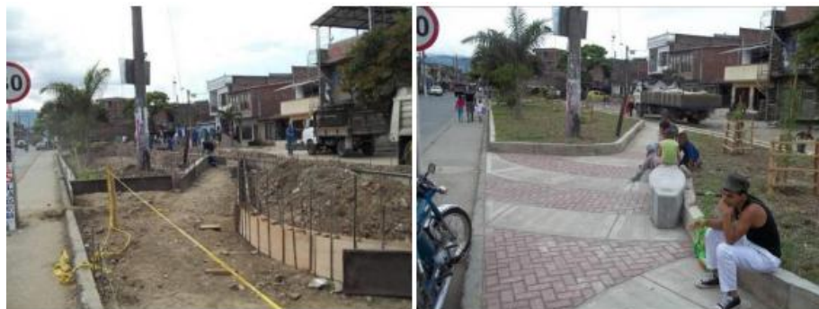
Parque B/el poblado Calle 72 u con cra. 28f. Durante (Izq) y Después (Der).