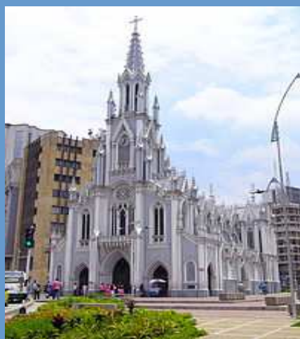
IGLESIA DE SAN ANTONIO

Es preciso señalar que la Norma que contempla lo relacionado con los bienes que hacen parte del Patrimonio Arquitectónico de la Ciudad, es el Acuerdo 0232 de 2007 , dentro del cual se Establece el deber de actualizar el " Catálogo de bienes de Interés Cultural ". (Ver Artículo 11).