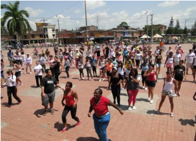
CICLOVIDA Sol de Oriente