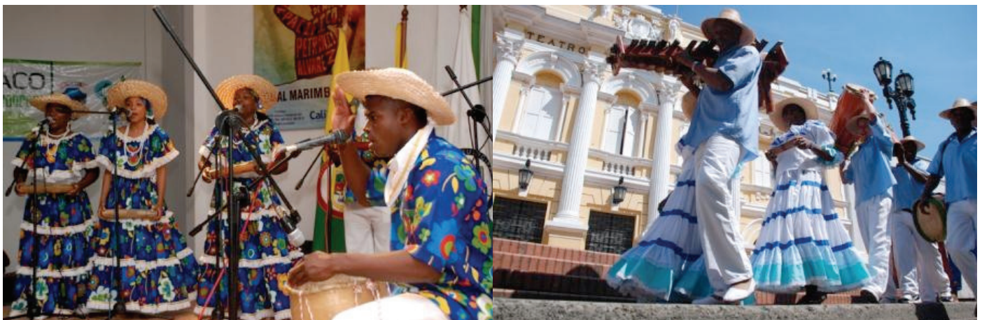
XVI Festival de Música del pacífico “Petronio Álvarez”

El festival se realizó con el desarrollo de Exposiciones, competencias y muestras empresariales. Su realización demandó una compleja logística teniendo en cuenta que gran parte de los participantes provenían de otros municipios. En total se contó con una asistencia diaria de 100.000 personas, a excepción del último día donde se registró una asistencia aproximada de 120.000 personas.