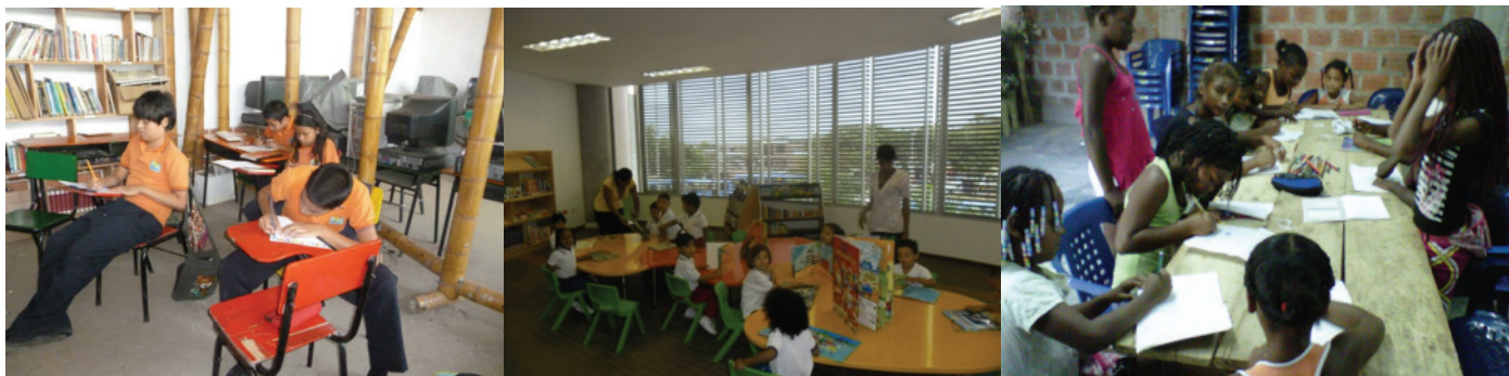
Red de Bibliotecas Públicas Comunitarias