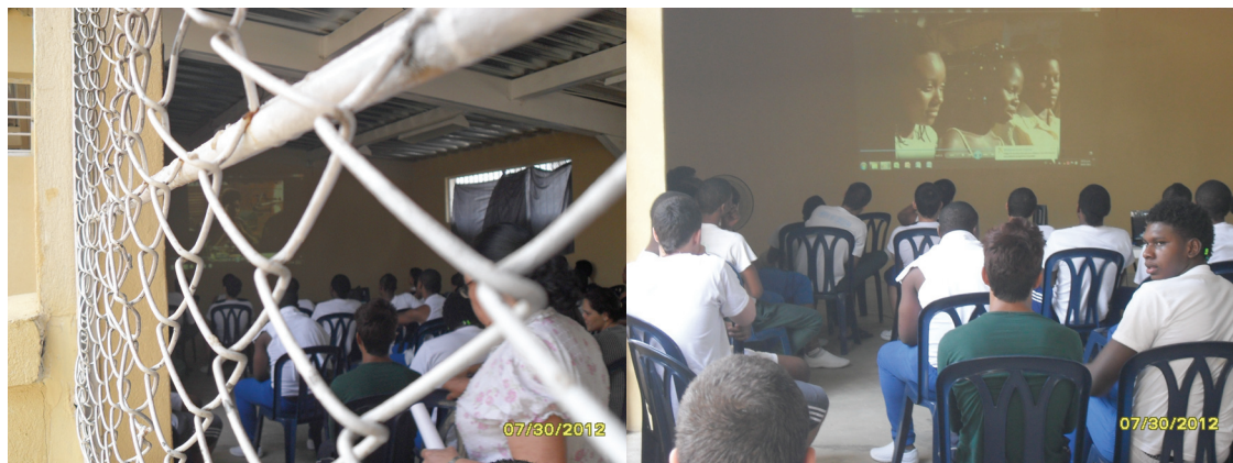
Cine Foros en los Centros de Formación Juvenil Buen Pastor y Valle del Lili - Julio 2012.

En la primera modalidad se reportan las jornadas realizadas en las comunas 13, 16 y 18 y en el colegio Miguel Camacho Perea, donde se trabajo con grupos de jóvenes, los largometrajes “Los sonidos invisibles” y “Radio Favela” el primero con el objetivo de motivar la reflexión sobre la cultura y tradiciones de la población afro descendientes, y el segundo orientado a promover la participación de los jóvenes en la transformación de sus realidades, con una presentación basada en un hecho de la vida real, donde se muestra cómo un grupo de jóvenes, de una favela en Brasil deciden crear una estrategia para visibilizar entre los habitantes de la favela y los representantes del estado las problemáticas que les afecta, por medio de una emisora pirata, que además contribuye a la creación de procesos culturales.