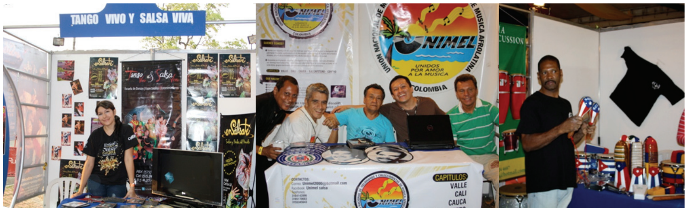
Feria de Emprendimiento