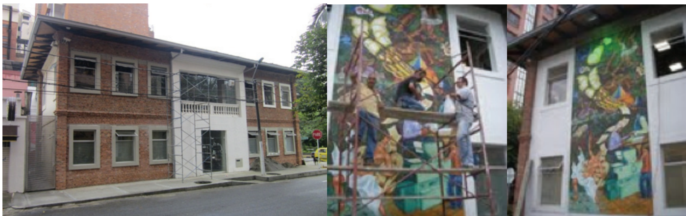
Biblioteca pública - Centenario