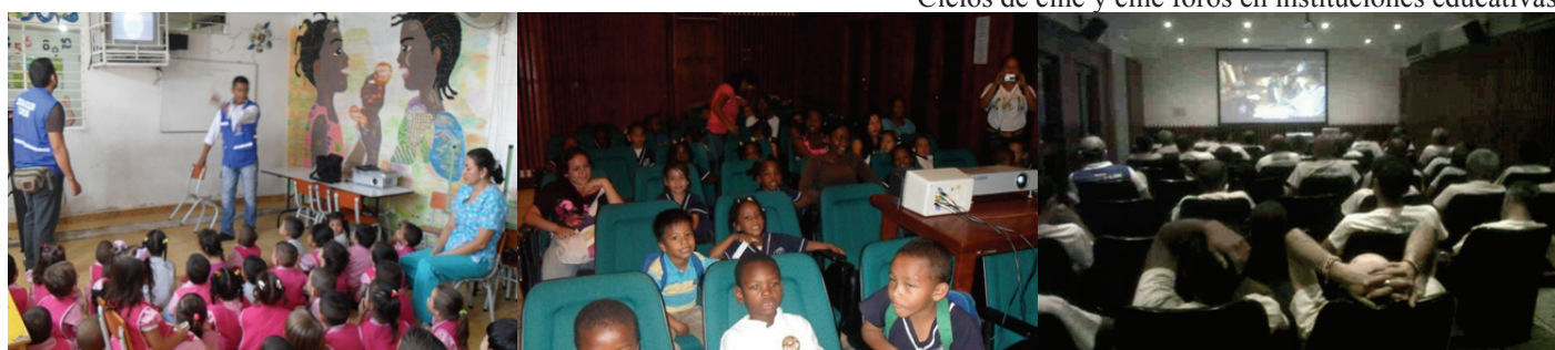
Ciclos de cine y cine foros en instituciones educativas

El programa cine al barrio, se desarrollo bajo la coordinación de la Audioteca municipal, en tres modalidades: La primera, orientada a la realización de Cine Foros, buscando promover la reflexión Crítica entre la población juvenil. La segunda articulada a las instituciones de educación infantil, y la tercera a la formación de gestores culturales, orientada a generar capacidad para el desarrollo del programa por comuna.