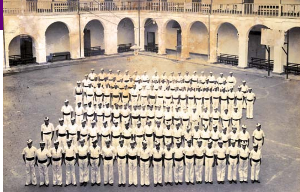
Niños en formación en el antiguo convento de San Agustín, fotografía 1938.

La discusión acerca de la formación del ciudadano y de cómo éste debía ser instruido, seguía siendo central en la construcción de la re-