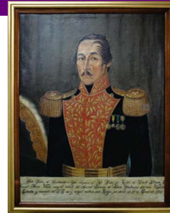
Oleo sobre lienzo, Santander.

Con dichas fundaciones en toda la república, se empezó a cristalizar el proyecto de Instrucción Pública basado en ideales que buscaban la formación de personas útiles a la patria y a la nación, como estrategia para el fortalecimiento del estado en construcción. En Cali se manifestó la necesidad de contar